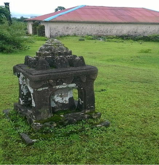
भोराई देवी मंदिर (सुधागड)