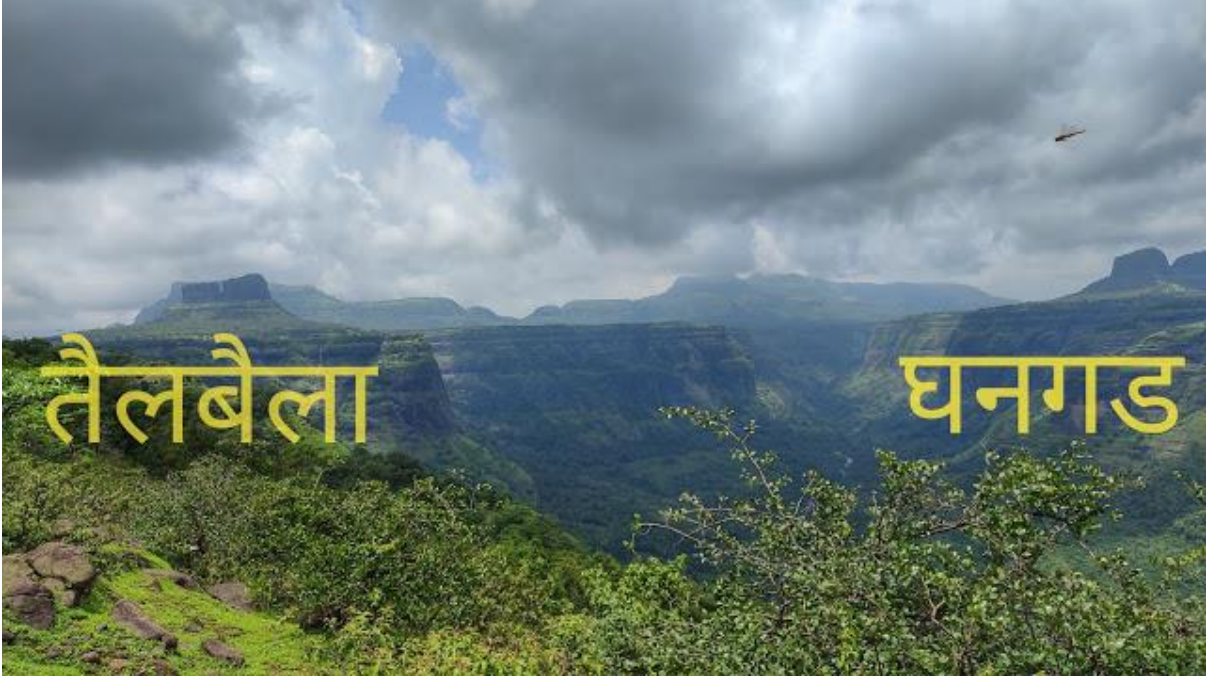
तैलबैला घनगड (सुधागड)