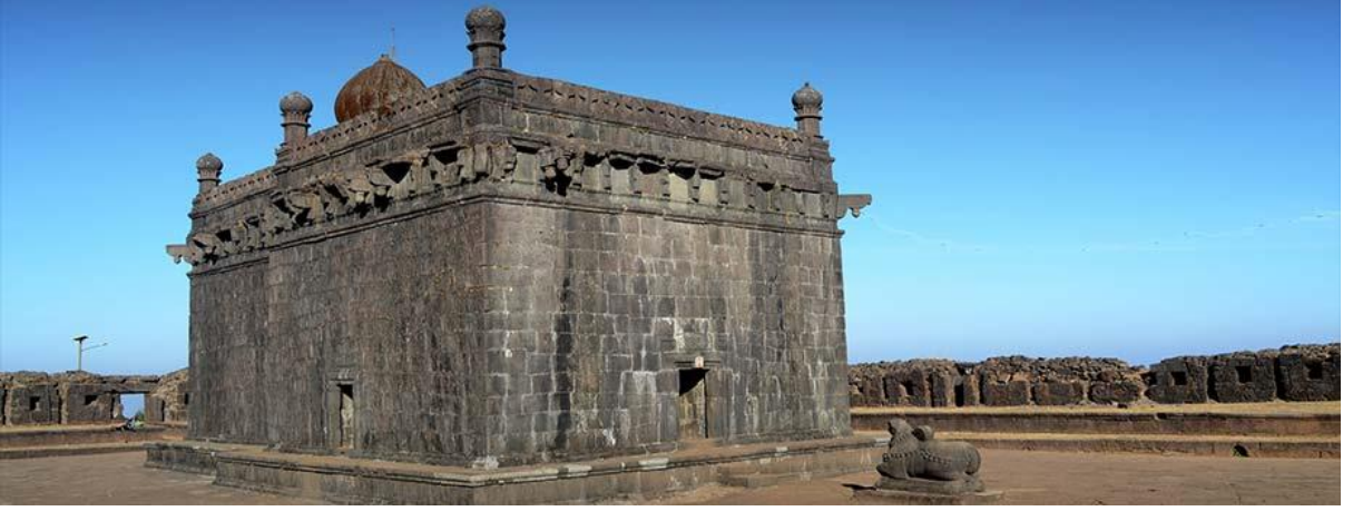
जगदीश्वर मंदिर (रायगड)