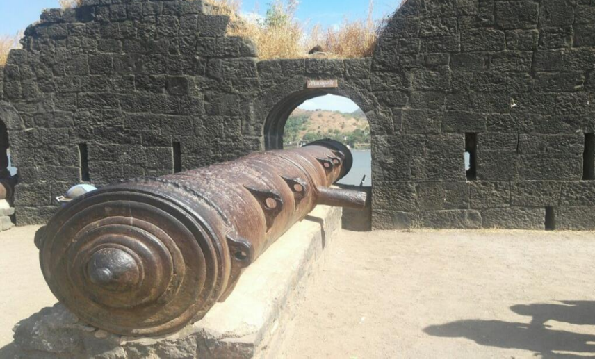
कलाल बांगडी तोफ (मुरुड-जंजीरा)