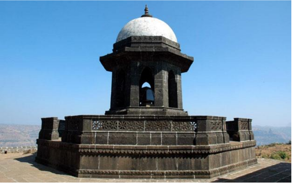
महाराजांची समाधी (रायगड)