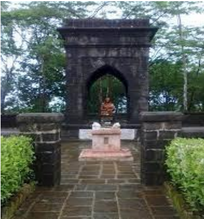
पाचाडचा जिजाबाईचा वाडा