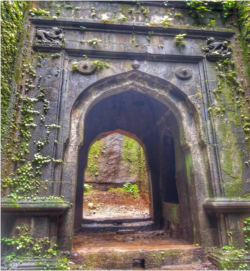
महा दरवाजा / दिंडी दरवाजा (सुधागड)