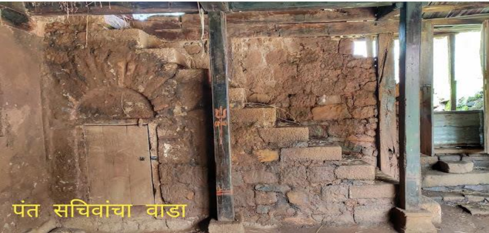
पंत सचिवांचा वाडा (सुधागड)