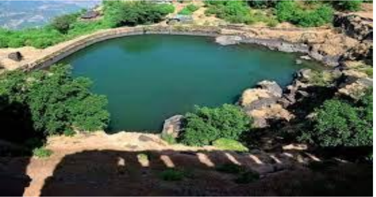
गंगासागर तलाव (रायगड)