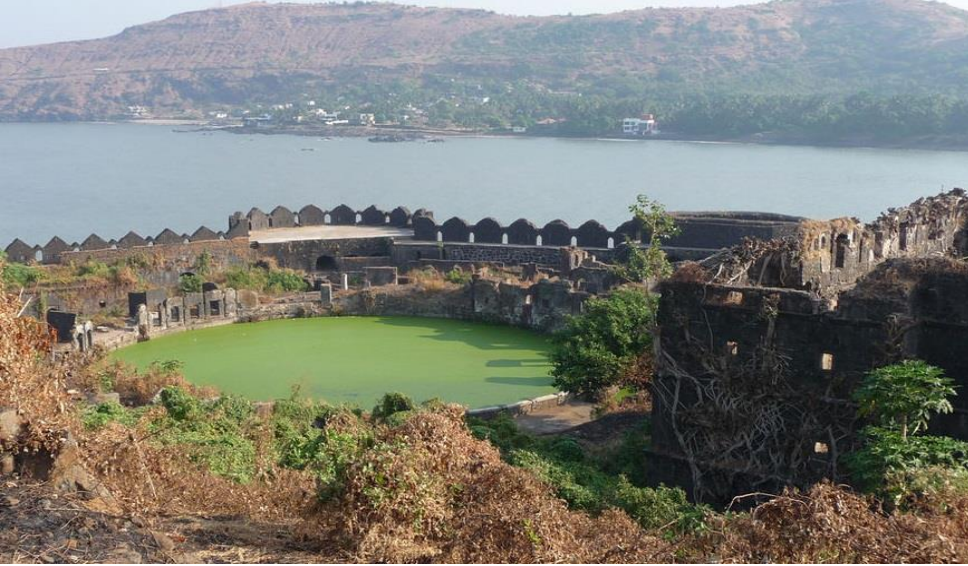
गोड्या पाण्याचे तलाव (मुरुड-जंजीरा)